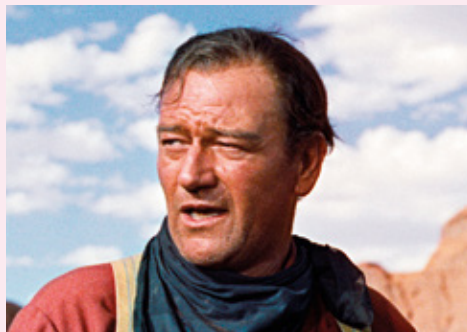
John Wayne dans La Prisonnière du désert