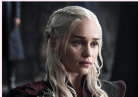
Emilia Clarke dans Game of Thrones