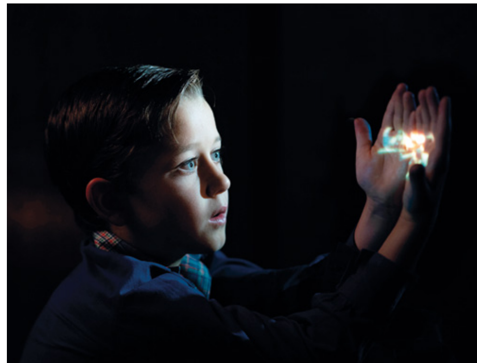
The Fabelmans de Steven Spielberg

L'école du spectateur présente aux élèves les principes de base de l'écriture cinématographique dans votre établissement.