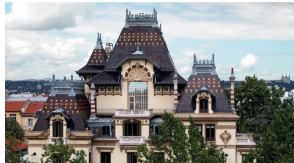
La villa Lumière de Monplaisir