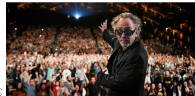
Tim Burton à la Halle Tony Garnier 2022