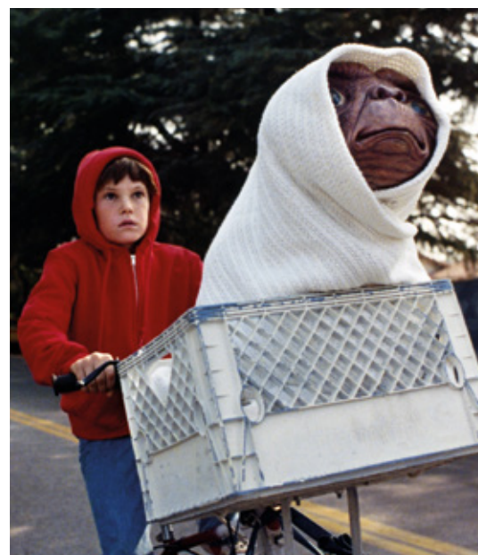
E.T. de Steven Spielberg