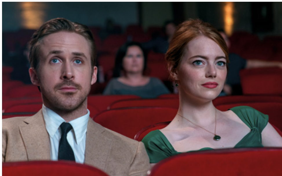
La La Land de Damien Chazelle

À l'ère d'Internet, du streaming et de la VOD, il devient capital de continuer à fréquenter le grand écran et la grande histoire du cinéma.