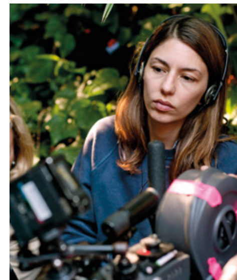
Sofia Coppola sur le tournage de Somewhere