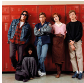
The Breakfast Club de John Hughes