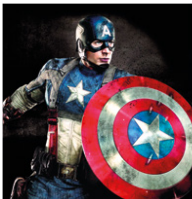
Captain America : First Avenger de Chris Evans