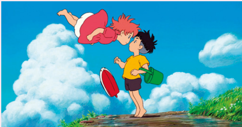
Ponyo sur la falaise d'Hayao Miyazaki

Une plongée dans l'histoire du cinéma d'animation !