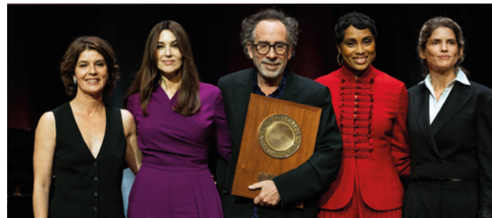
Tim Burton Prix Lumière 2022

Le plus grand festival de patrimoine du monde qui accueille de nombreuses célébrités françaises et du monde entier.