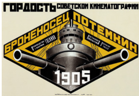
Le Cuirassé Potemkine de Serguei M. Eisenstein

Dans une société où nous sommes constamment abreuvés d'images, il faut savoir en décrypter les dangers d'embrigadements. Il faut aussi comprendre les techniques du langage cinématographique.