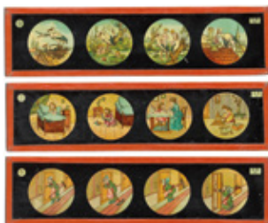
Plaques colorées de lanterne magique

Cet atelier fait découvrir les principales inventions qui ont préparé l'avènement du Cinématographe. Les enfants peuvent assister à la démonstration d'un Thaumatrope, d'un Zootrope et autres jouets optiques.