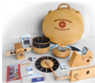
Malle à Balbu'Ciné

Conseillé à partir de la MS au collège (3 e )