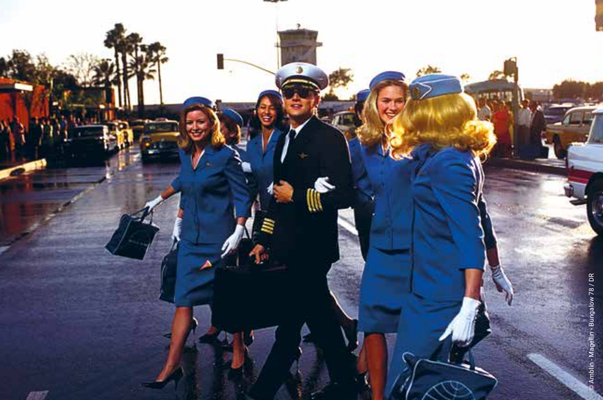
Leonardo DiCaprio dans Arrête-moi si tu peux (2002)