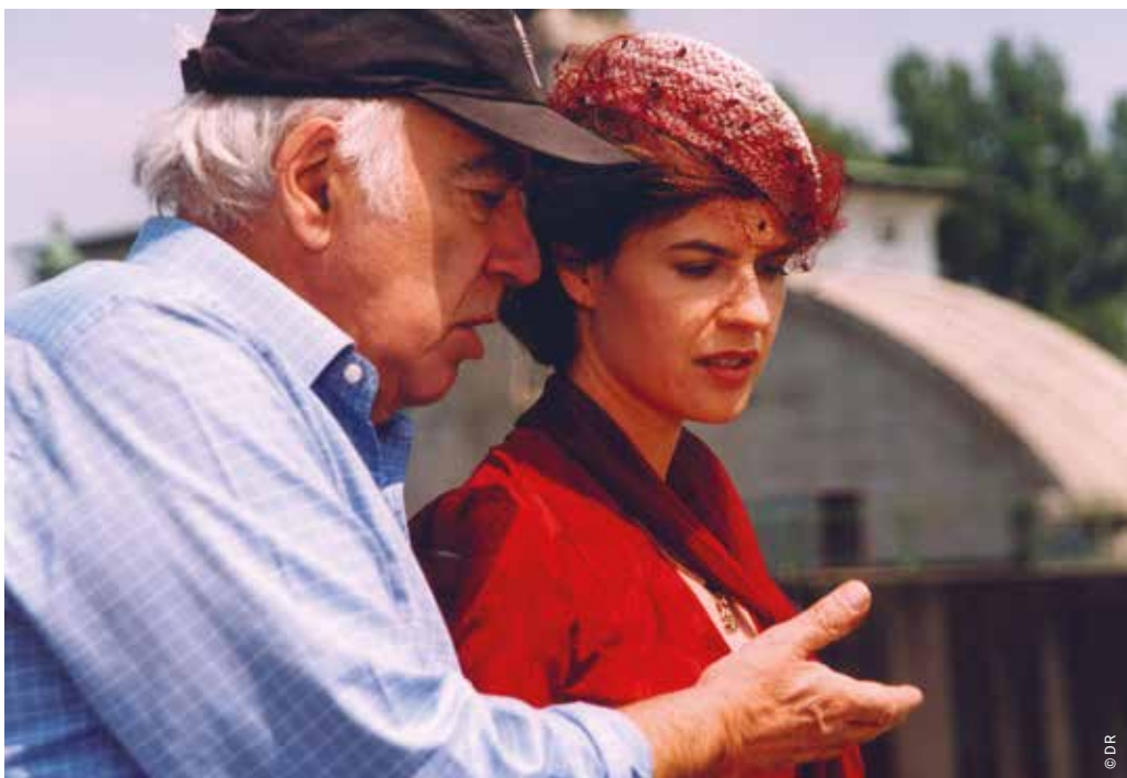
Jacques Deray et Irène Jacob sur le tournage de Lettre d'une inconnue (2002)

En partenariat avec France Télévisions et Jazz Radio et avec le soutien de la SACD